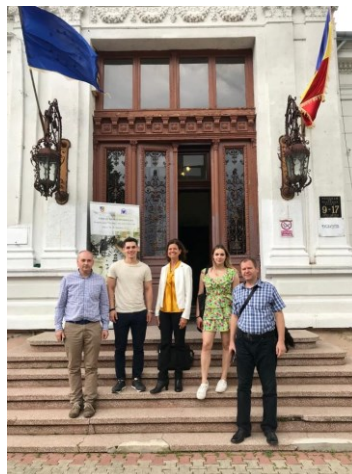
Vizita la Muzeul Petrolului din Ploiesti 13.06.2019

Anul 2020 a înregistrat un recul în activitatea sucursalei noastre ca urmare a apariției pandemiei de COVID-19 prin anularea sau restrângerea activităților prin instituirea regulilor de protecție sanitară și/sau a stării de urgență/alertă care de asemenea au restrâns mobilitatea și posibilitatea de organizare și participare la manifestări cu caracter geologic. Ne propunem pentru viitor pe lângă organizarea de activități ce presupun participarea fizică și implementarea unor activități online care să crească vizibilitatea sucursalei Prahova-Ploiești a SGR.