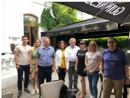
Vizita la Muzeul Petrolului din Ploiesti 13.06.2019

Societatea Geologică a României Str. Caransebeș 1, sector 1, 012241 București www.geosociety.ro