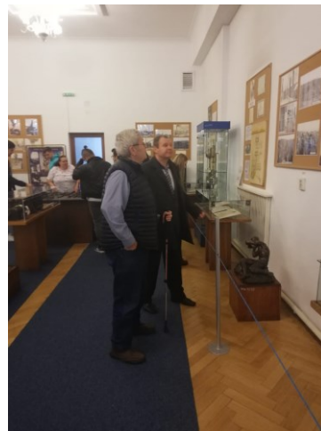
Vizita la Muzeul Petrolului din Ploiești 20.03.2019