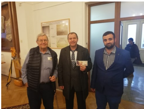
Vizita la Muzeul Petrolului din Ploiești 20.03.2019

Participanți: decanul facultății IPG, cadre didactice de la departamentul Geologie Petrolieră și Inginerie de Zăcămint (7 persoane), studenți de la programele de studii Geologia resurselor petroliere și respectiv Inginerie de petrol și gaze (aprox. 40 persoane)